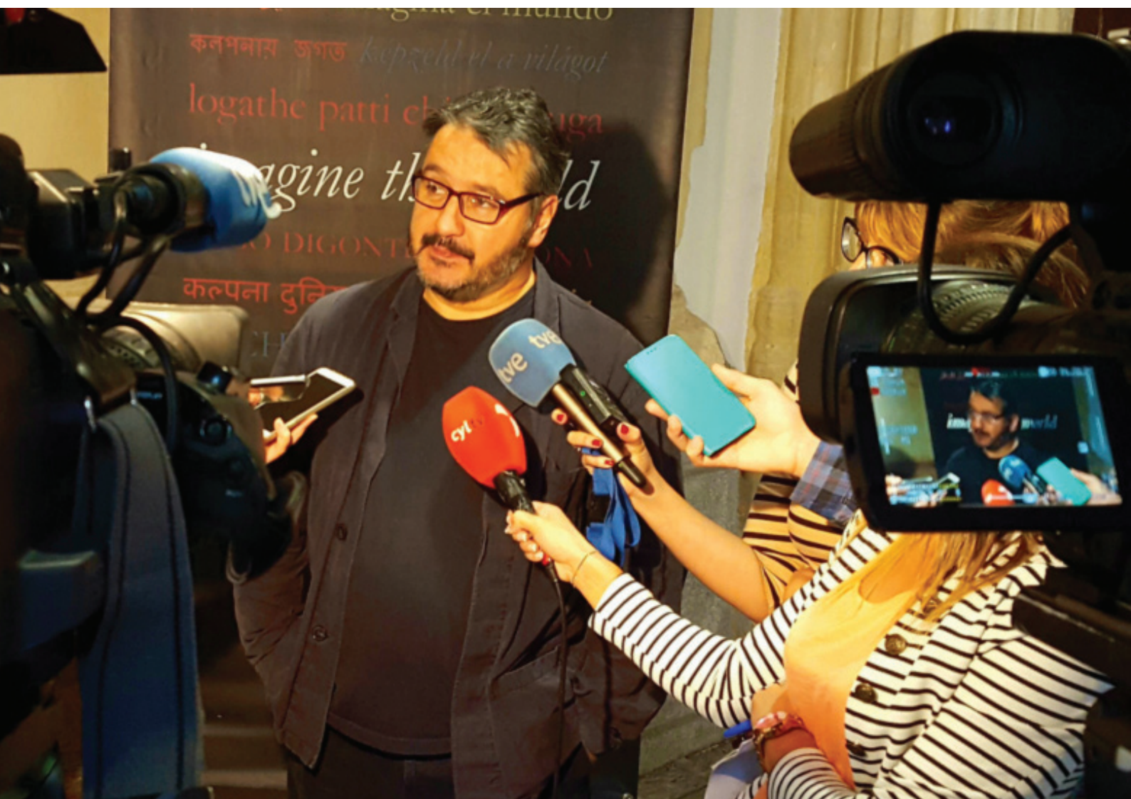
Peter Florence, Director de Hay Festivals

La twittersfera estaba llena de referencias a #HayFestivalSegovia. Fue un trending topic el viernes 23 y sábado 24 de septiembre y recibió una amplia cobertura en los medios, con un total de más de 1.000 páginas en la prensa española e internacional. 2016 consiguió más cobertura en televisión y radio que nunca.