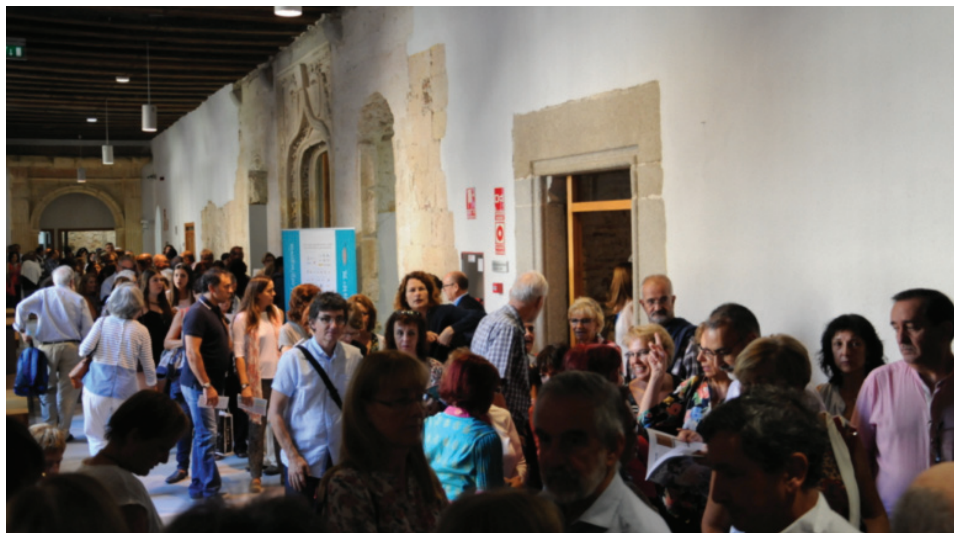
IE University se convirtió en un hub

Tras el debate, se inauguraron las dos primeras exposiciones del Festival: una obra del escultor español Carlos Alberto, situada bajo el acueducto de Segovia y otras en los jardines del Félix Ortiz; y una instalación de sonido creada por el artista noruego Per Barclay en la Alhóndiga. Hubo varios conciertos de saxofón y piano durante el día.