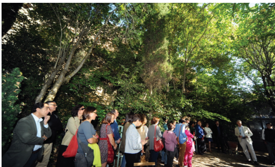
Jardín de San Marcos del Romeral