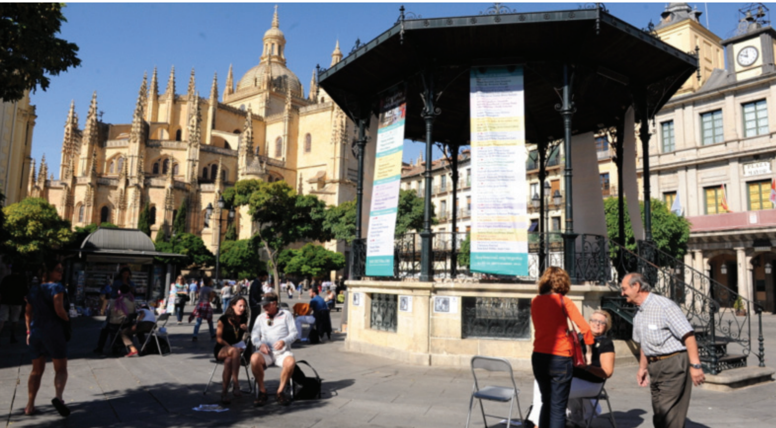
Los Susurradores de la Poesía en la Plaza Mayor

Estamos agradecidos a BMW y RENFE por proporcionar el transporte oficial y contar con los coches antiguos y motores de bomberos del siglo pasado para el transporte dentro de la ciudad.