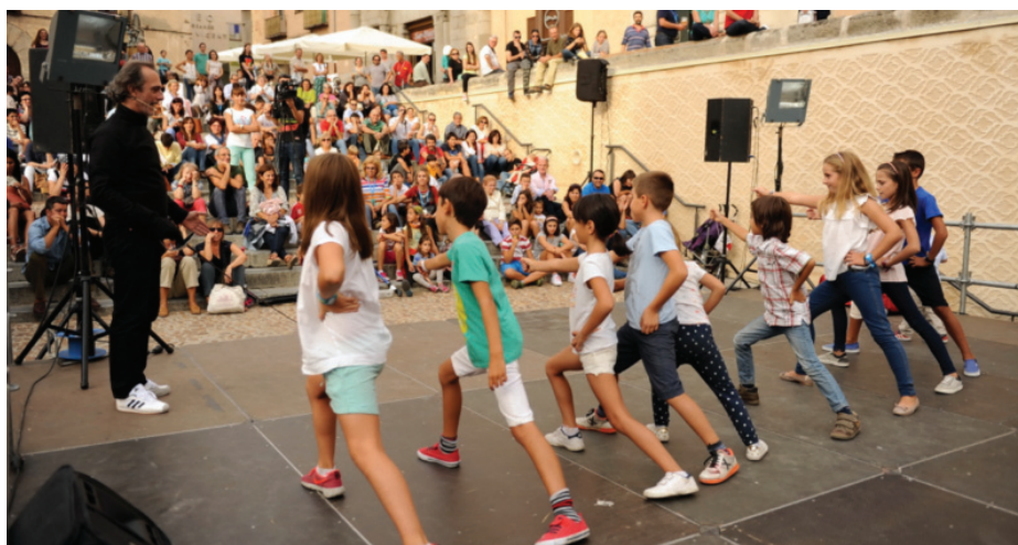
Celebrando Shakespeare y Cervantes, plaza San Martín