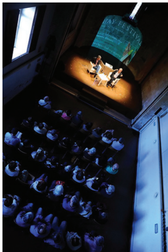
Iglesia San Nicolas

“ Conversaciones para saciar al lector. Ayuda a tejer complicidades que garantizan fieles cada año. Lo que se muda son los protagonistas”