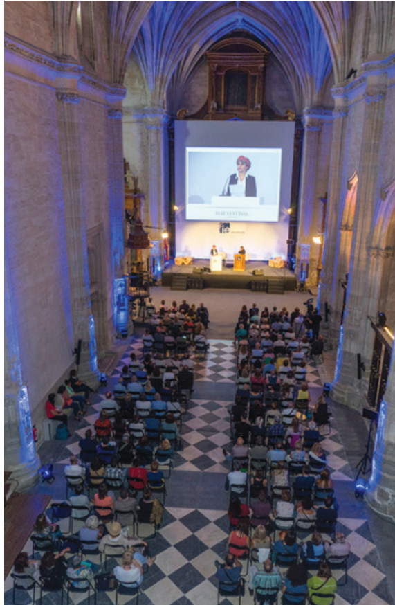
Convento Santa Maria La Real

“...para conseguir situar a una pequeña ciudad castellana en el mapa de los eventos culturales más importantes del mundo ”