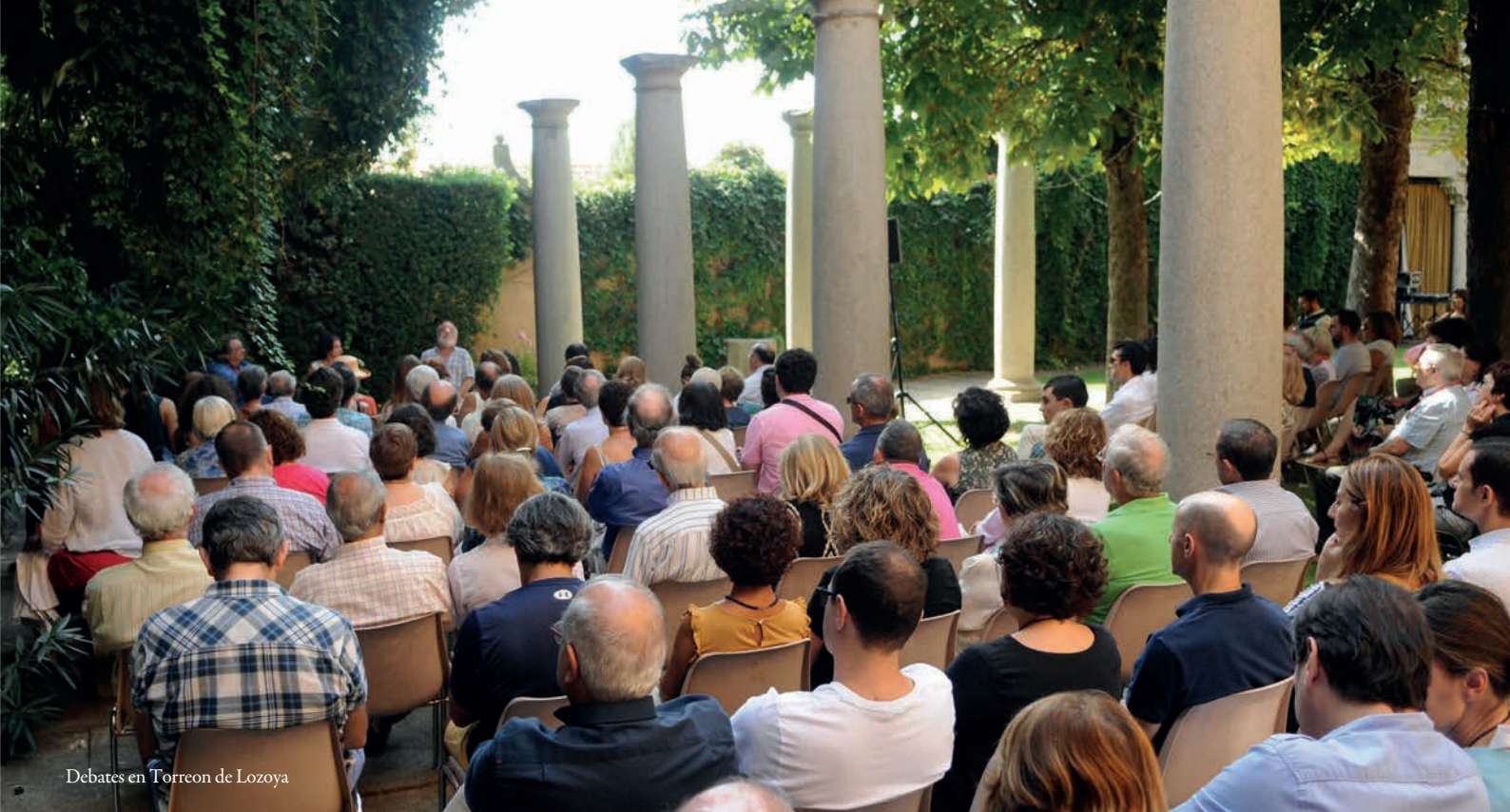
Debates en Torreón de Lozoya