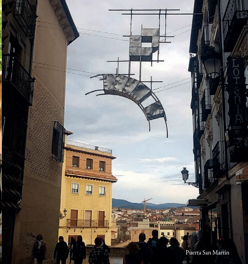
Puerta San Martín