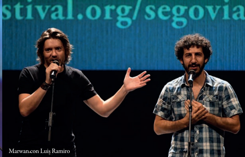
Marwan con Luis Ramiro