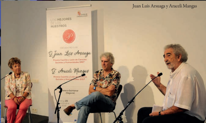
Juan Luis Arsuaga y Araceli Mangas