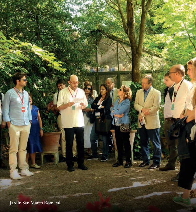
Jardín San Marco Romeral