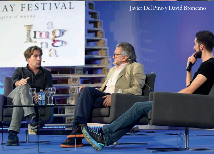
Javier Del Pino y David Broncano