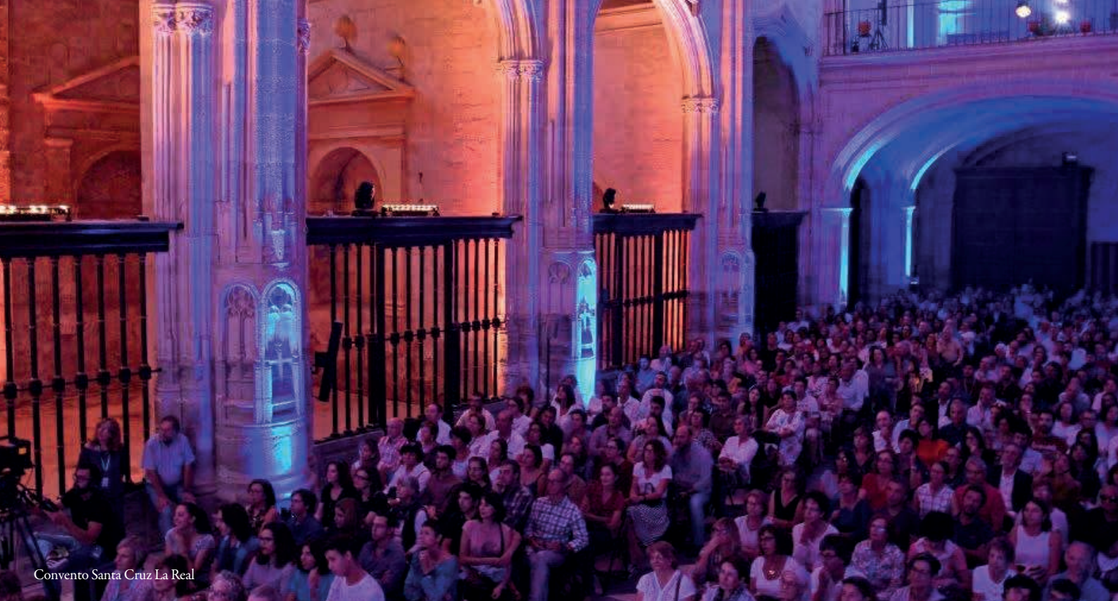
Convento Santa Cruz La Real