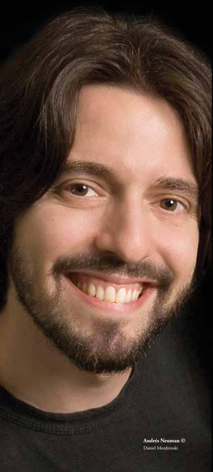
Andrés Neuman