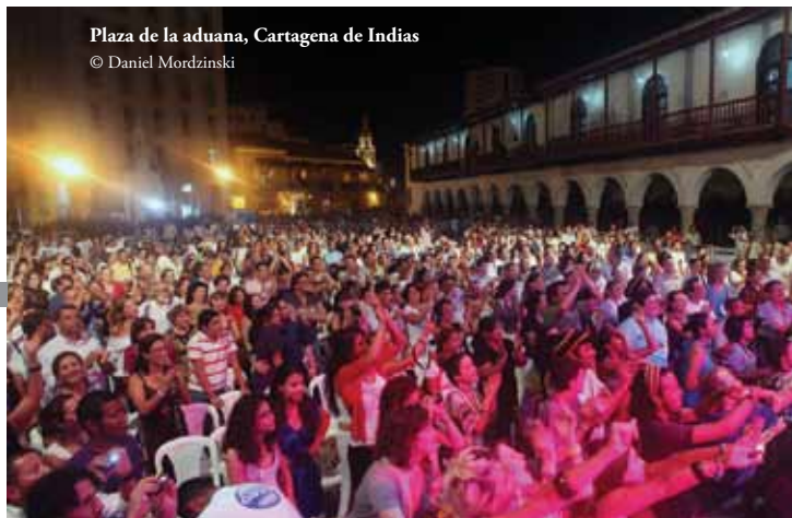
Plaza de la aduana, Cartagena de Indias