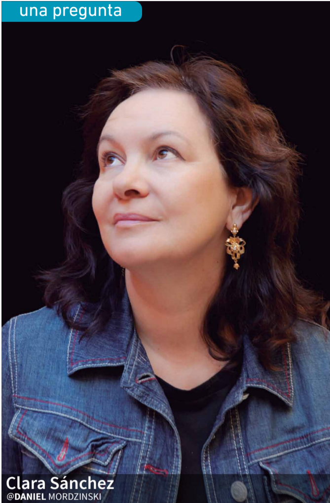
Clara Sánchez